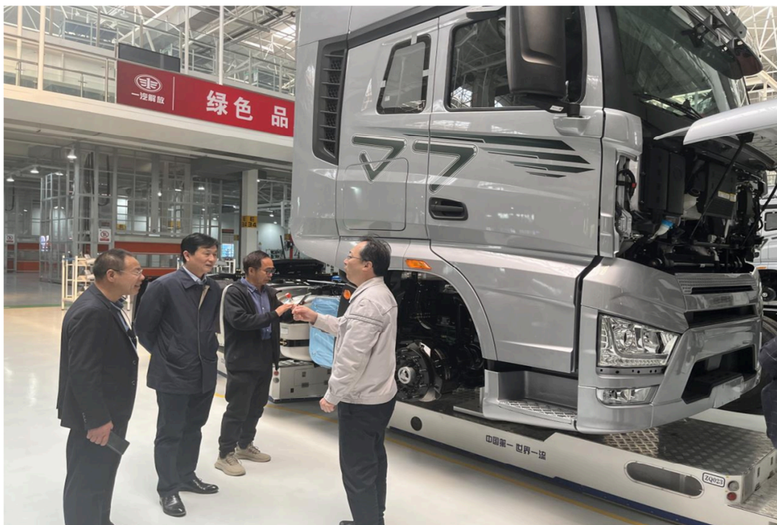
图 7-1 院领导在一汽解放有限公司调研