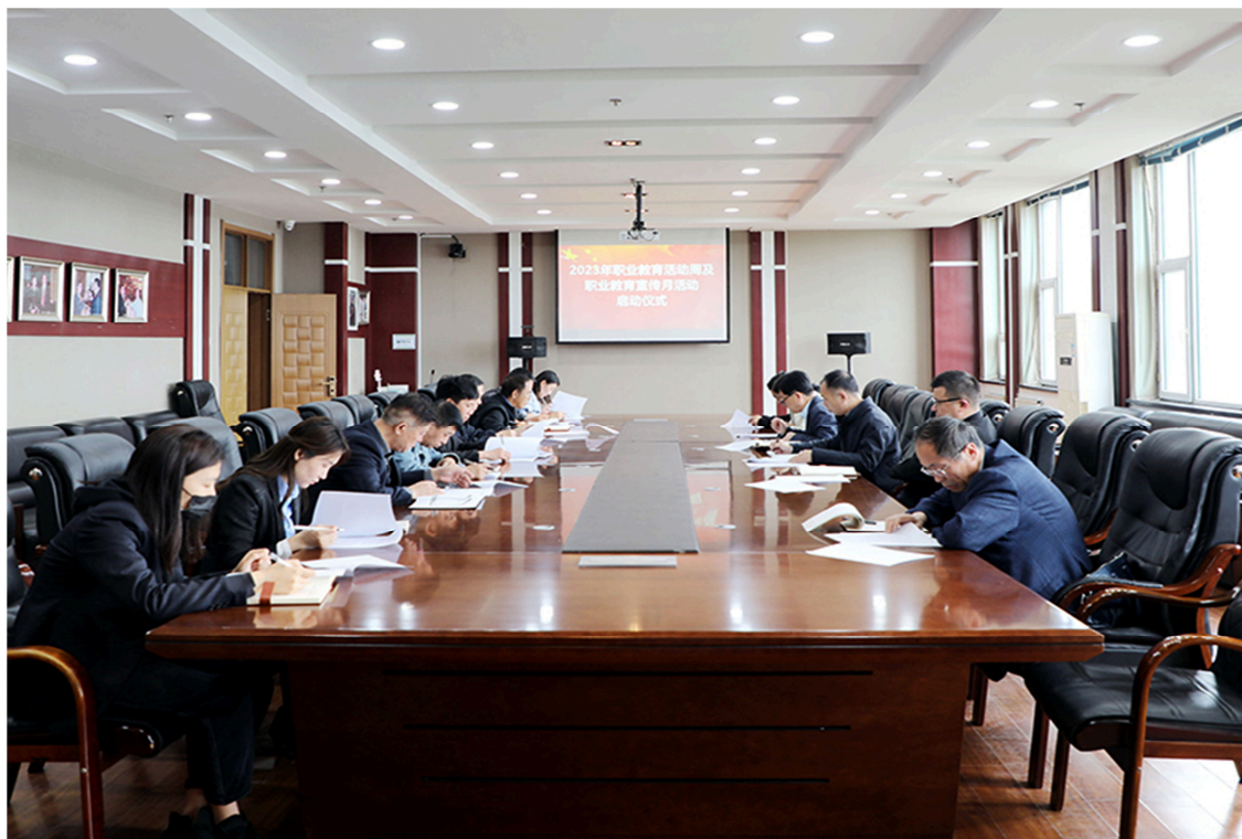
图 4-3 学院部署职教宣传周会议