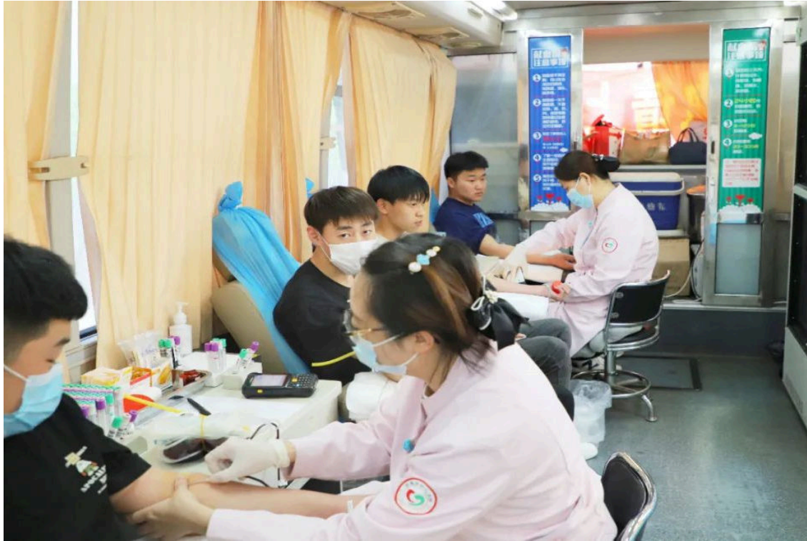
图 6-1 高校献血季，青春热血正当时