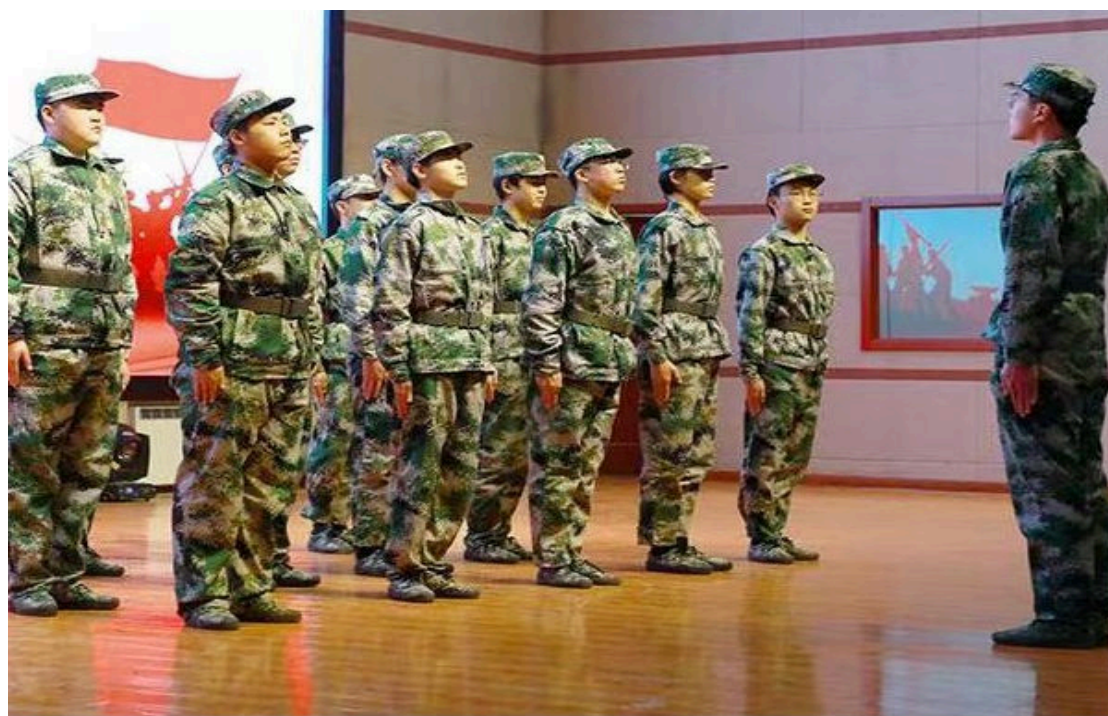
图 1-4 兵役班军训验收

准军事化管理倡导以军队的纪律规范学生，以军人的精神教育学生，以军营的作风感染学生；坚持思想教育与严格管理相结合，学校教育和社区教育相结合，理论教育与生活教育相结合；坚持以人为本，以德育人，通过建立严格的管理机制、高效的运行机制、积极的激励机制，切实提高学生素质。我们提出职业学校学生良好习惯养成策略的研究也是基于对学校的教育改革和发展的认识，是学校教育由普通的职业教育向高素质职业教育转变的有效保证（如图 1-4 所示）。