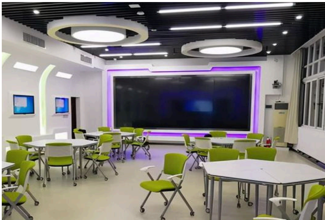
图 2-1 智慧教室

实现跨校区远程授课（参见图 2-1 所示），未来 2 年还将建设 2 间智慧教室，打造智慧教学环境；积极将教学资源、服务和管理搬到云端，探索疫情防控与常态化条件下混合教学新模式。