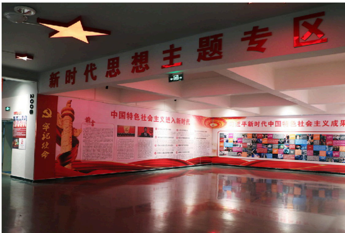
图 1-1 红色文化长廊

坚持红色文化传承，打通党建育人与弘扬当代工匠精神的融通途径。多措并举形成学院百花齐放的红色文化氛围，加大红色文化与当代工匠精神的宣传教育，深挖内涵，结合高职专业特点和师生特点，开展形式多样的红色展示活动。如在 7 号教学楼走廊设计“红色长廊”，增强红色文化与当代工匠精神的辐射渗透力，培养更多社会主义事业接班人和建设者（如图 1-1）。