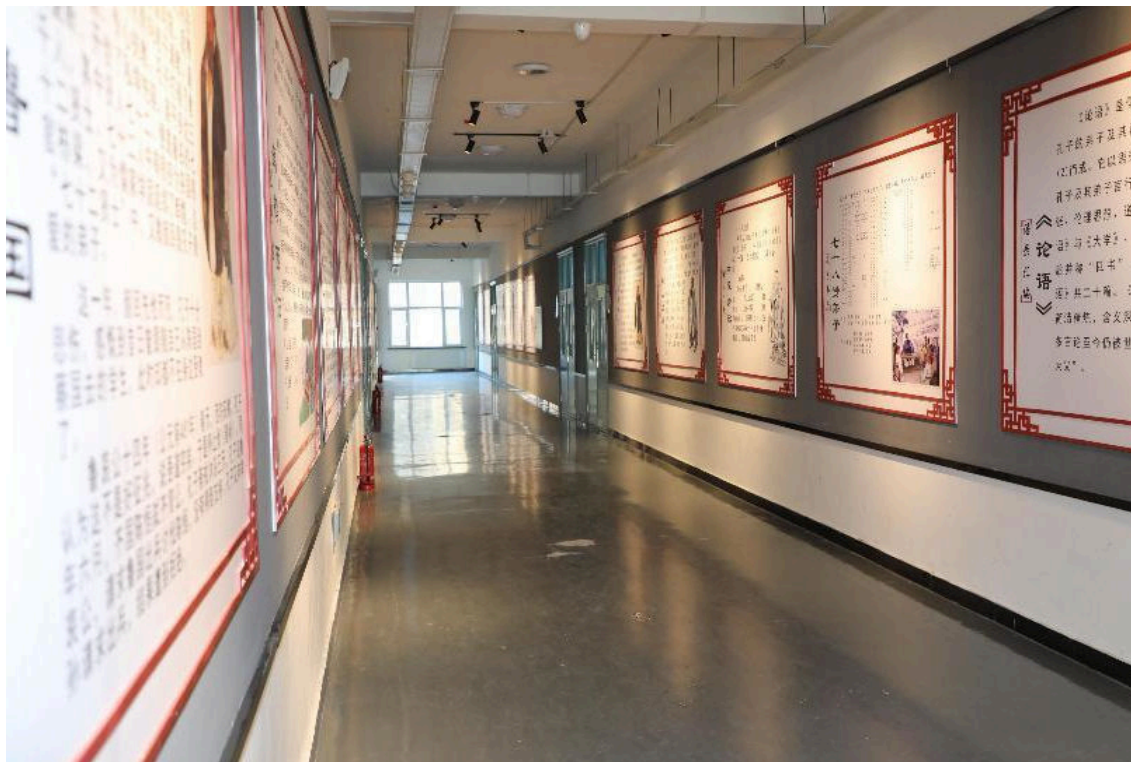
图 1-3 国学文化墙

学院把 7 号教学楼宽敞明亮的走廊打造成国学文化长廊，来到这里仿佛置身春秋战国时代，感受儒家文化仁礼一体和道家文化崇尚自然，以及中国几千年的文化底蕴（如图 1-3）。