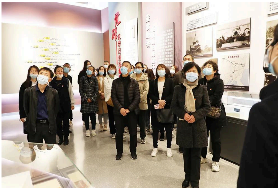
图 1-2 干部教师参观红色博物馆